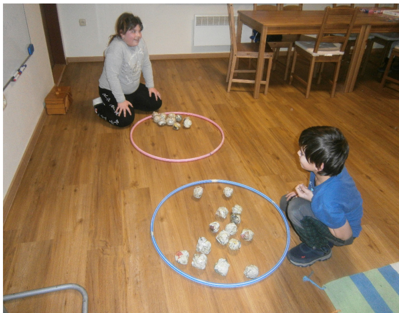
Hra na veverky, Knihovna Hrobce