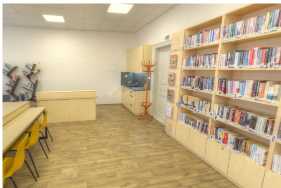
Knihovna v Čížkovicích

A protože se knihovny mění z prostředí tichého studia na místa k setkávání, nabízíme vám kromě knižního fundusu čížkovického a výměnného souboru litoměřického i zábavu (nejen) pro děti. Věřte, že zábavu mnohdy velmi hlučnou.