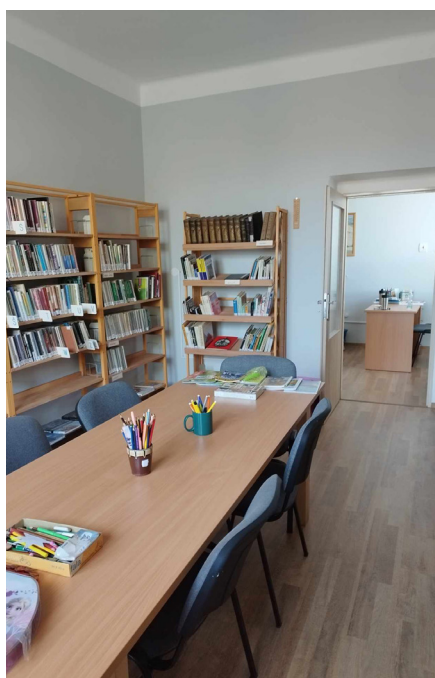
Kyškovice, Roudnice n. L., Mnetěš