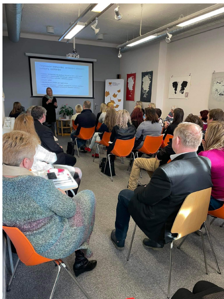
Setkání starostů a starostek v Knihovně Karla Hynka Máchy v Litoměřicích

semináře byly informace z regionu, nabídka metodického centra, a kladli jsme také důraz na důležitost významu regionálních funkcí podporovaných Ústeckým krajem. Na podzim letošního roku tuto úspěšnou akci rádi zopakujeme.