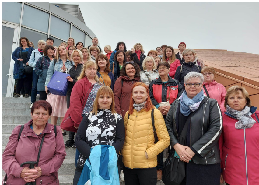
Dvoudenní výjezdní seminář

Děkujeme obecním úřadům za finanční podporu svých knihovnic.